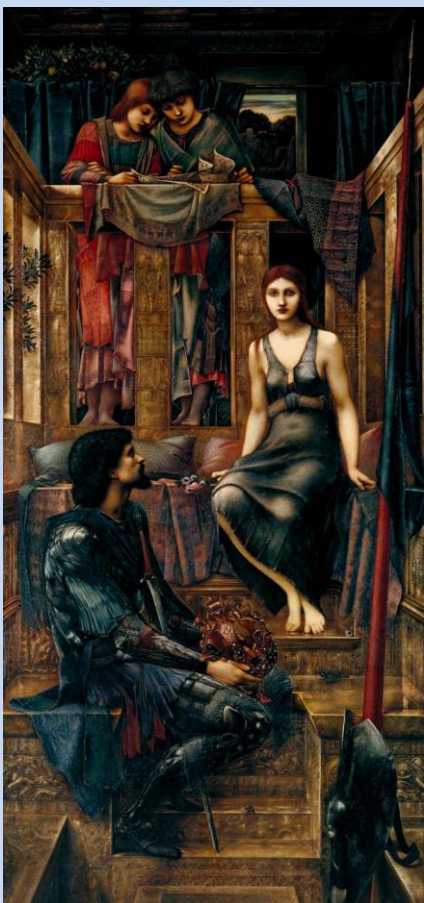
King Copethua and the Beggar Maid, 1888, de Edward Burne-Jones

Asimismo, el rey Altazor se prosterna ante la mirada insondable de la mujer total. Para mí, el rey Cophetua de Burne-Jones, ataviado con una hermosa armadura negra, sosteniendo humildemente su corona entre las piernas, es una de las imágenes que podrían haberse metamorfoseado en este Altazor Rey de Huidobro del Canto II.