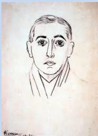
Huidobro por Pablo Picasso