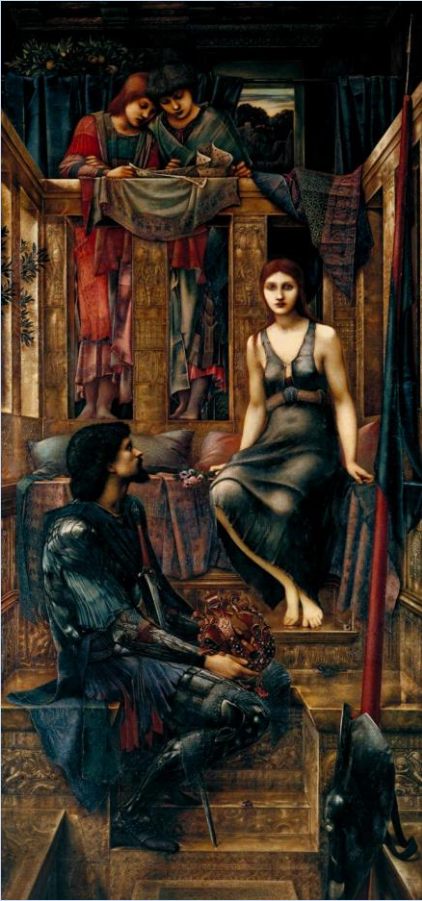
King Copethua and the Beggar Maid, 1888, de Edward Burne-Jones

Asimismo, el rey Altazor se prosterna ante la mirada insondable de la mujer total. Para mí, el rey Cophetua de Burne-Jones, ataviado con una hermosa armadura negra, sosteniendo humildemente su corona entre las piernas, es una de las imágenes que podrían haberse metamorfoseado en este Altazor Rey de Huidobro del Canto II.